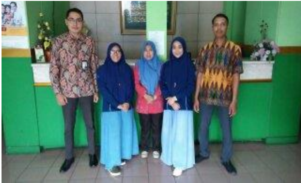
Wawancara dengan penjual jamu nasabah di BPRS UMMU