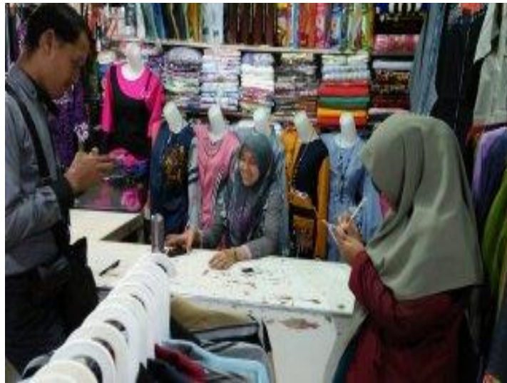
Cash pick up antar jemput angsuran ke pasar