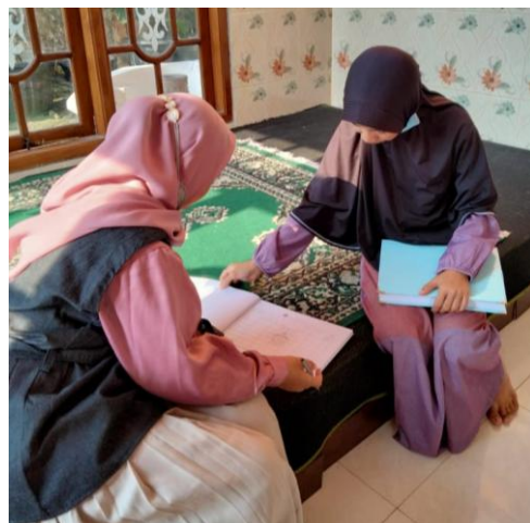
Sumber: Dokumentasi Peneliti