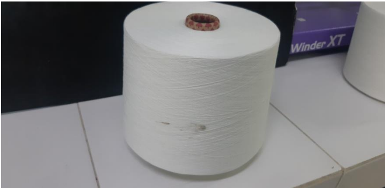
Contoh Benang Cacat Whiskers