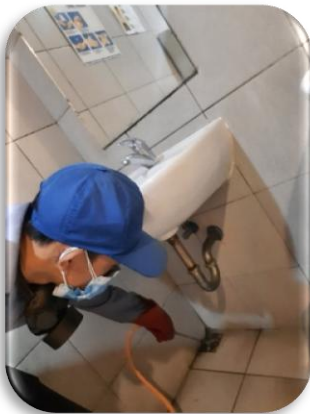
Gambar : Proses pelayanan PT ETSA pengendalian hama serangga.