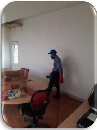
Gambar : Proses pelayanan PT ETSA saat penyemprotan disinfeksi area pelanggan.