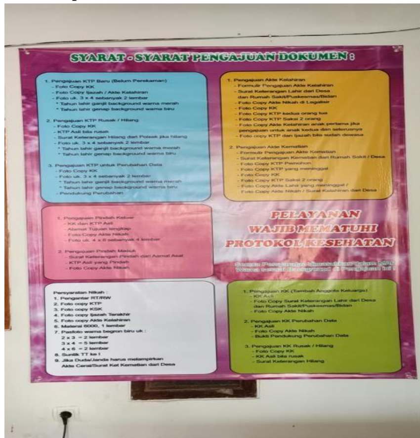
Lampiran 1. Gambar penelitian