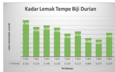
Gambar 2. Grafik Analisis Kadar Lemak

Gambar 2. menunjukkan bahwa perlakuan yang mempunyai kadar lemak terendah diperoleh oleh perlakuan F3R2 (1,5% kadar ragi dan 72 jam lama fermentasi : 100 gr biji durian) sebesar 0,077%. Kadar lemak tertinggi diperoleh pada perlakuan F1R1 (1% kadar ragi dan 24 jam lama fermentasi : 100 gr biji durian) sebesar 0,163%. Semakin cepat waktu fermentasi