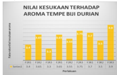
Gambar 6. Grafik Analisis Sensori Terhadap Aroma

Gambar 6. memperlihatkan rata-rata nilai kesukaan panelis terhadap aroma tempe biji durian mempunyai persentase terendah yaitu perlakuan F1R3 (2% kadar ragi dan 24 jam lama fermentasi : 100 gr biji durian) dengan nilai sebesar 3,3, sedangkan persentase rata-rata nilai terhadap aroma tertinggi yaitu perlakuan F3R3 (2% kadar ragi dan 72 jam lama fermentasi : 100 gr biji durian) dengan nilai sebesar 3,9 yang berarti menyukai.