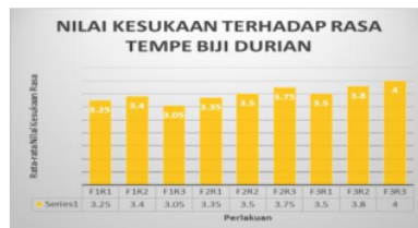
Gambar 4. Analisis Sensori Terhadap Rasa

Gambar 4. memperlihatkan rata-rata nilai kesukaan panelis terhadap rasa tempe biji durian mempunyai persentase terendah yaitu perlakuan F1R3 (proporsi 2% kadar ragi dan 72 jam lama fermentasi : 100 gr biji durian) dengan nilai sebesar 3,05, sedangkan persentase tertinggi terhadap rasa tempe biji durian yaitu perlakuan F3R3 (proporsi 2% kadar ragi dan 72 jam lama fermentasi : 100 gr biji durian) yaitu dengan nilai sebesar 4 yang berarti menyukai.