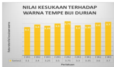
Gambar 5. Grafik Analisis Sensori Terhadap Warna

Gambar 5. memperlihatkan rata-rata nilai kesukaan panelis terhadap warna tempe biji durian mempunyai persentase terendah yaitu perlakuan F1R1 (proporsi 1% kadar ragi dan 24 jam lama fermentasi : 100 gr biji durian) dengan nilai sebesar 3,1, sedangkan persentase tertinggi terhadap warna tempe biji durian yaitu perlakuan F3R3 (proporsi 2% kadar ragi dan 72 jam lama fermentasi :