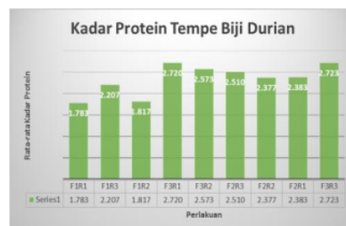
Gambar 1. Grafik Kadar Protein Tempe Biji Durian

Gambar 1. memperlihatkan bahwa perlakuan yang mempunyai kadar protein terendah diperoleh dari perlakuan F1R1 (kadar ragi 1%, lama fermentasi 24 jam: 100 gr biji durian) sebesar 1,783 %. Kadar protein tertinggi diperoleh pada perlakuan F3R3 (2 % kadar ragi dan 72 jam lama