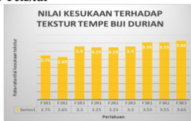
Gambar 7. Grafik Analisis Sensori Terhadap Tekstur

Gambar 7. memperlihatkan rata-rata nilai kesukaan panelis terhadap tekstur tempe biji durian mempunyai persentase terendah yaitu perlakuan F1R2 (1,5 % kadar ragi dan 48 jam lama fermentasi : 100 gr biji durian) dengan nilai sebesar 2.65, sedangkan rata-rata nilai kesukaan panelis terhadap tekstur tertinggi yaitu perlakuan F3R3 (2 % kadar ragi dan 72 jam lama fermentasi : 100