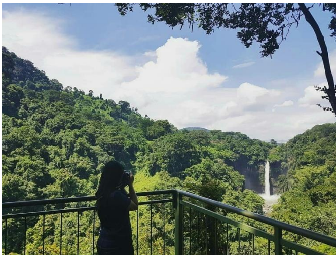
Gambar 13 : Air Terjun Baong