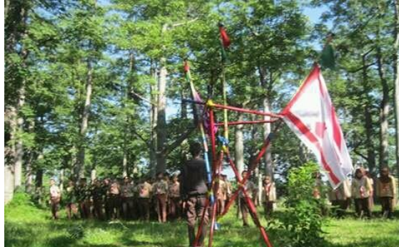
Gambar 2 : Outbound Diklat Pramuka