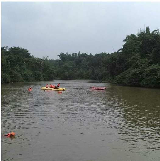
Gambar 11 : Embung / Waduk Buatan