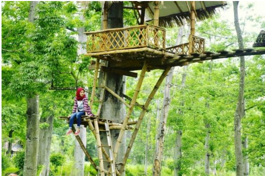
Gambar 1 : Rumah Pohon untuk spot foto