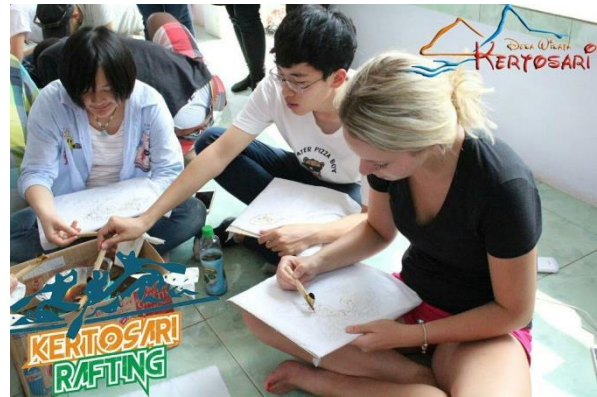
Gambar 6 : Pelatihan Batik