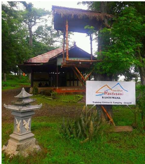
Gambar 4 : Pendopo Randuwana Learning Center