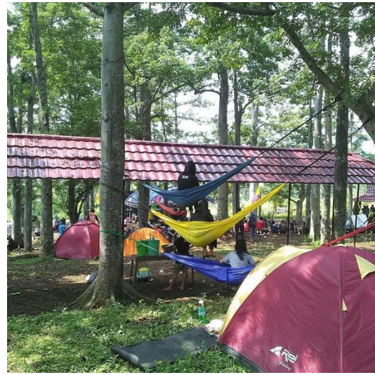
Gambar 12 : Camping Ground