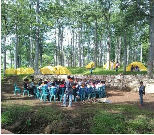
Gambar 9 : Camping Ground