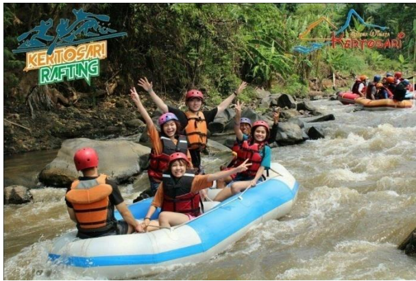
Gambar 5 : Fun Rafting