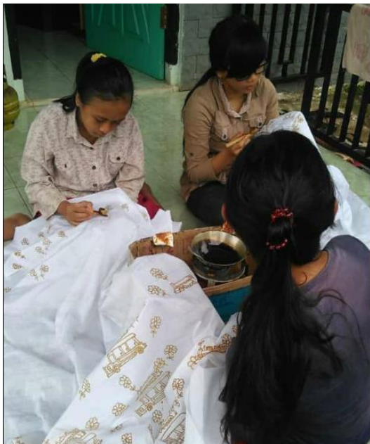
Gambar 3 : Pelatihan Batik