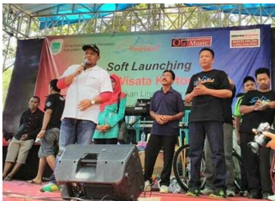
Gambar 7 : Peresmian Desa Wisata Kertosari