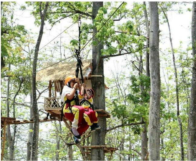
Gambar 14 :Outbound Flying Fox