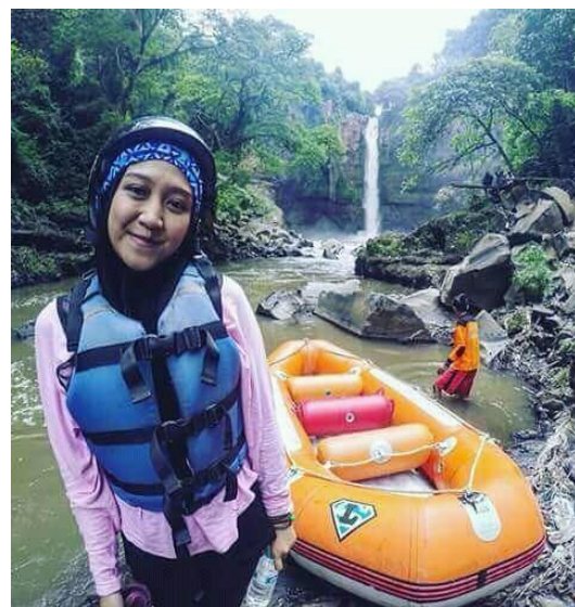
Gambar 8 : Fun Rafting