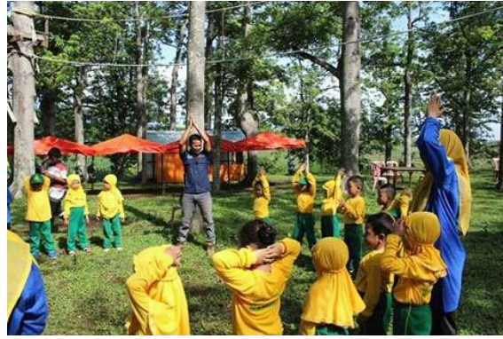
Gambar 10 : Outbound dan edukasi