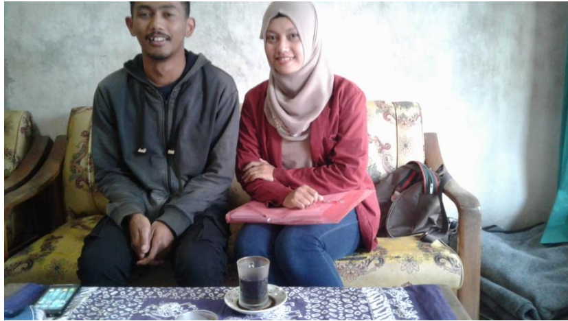
Bersama Pengelola Pariwisata Desa Kalipucang