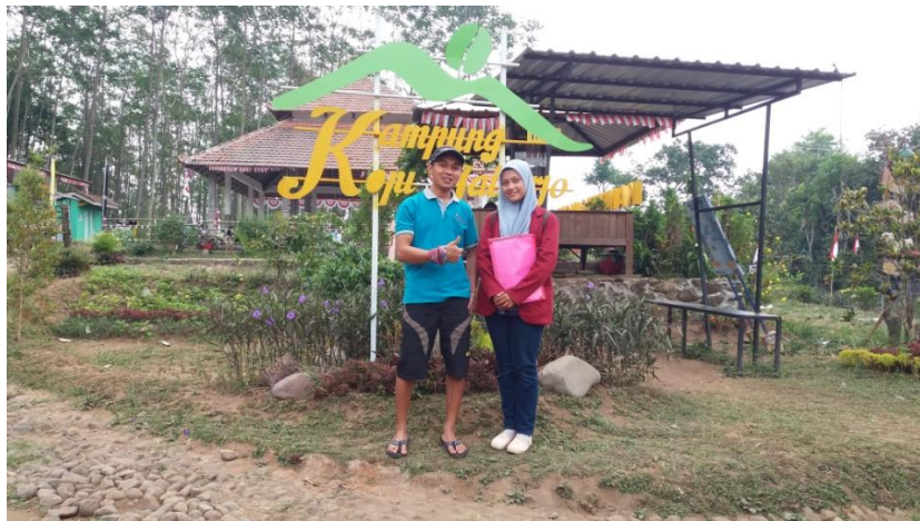
Bersama Pengelola Pariwisata Kampung Kopi Jatiarjo