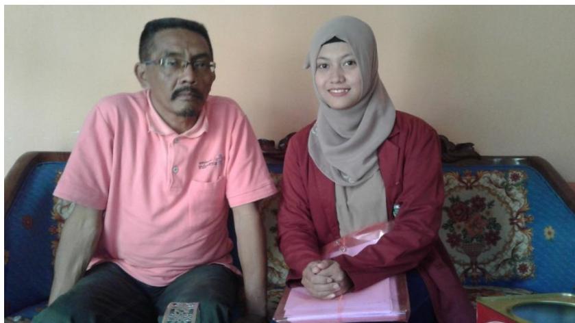
Bersama Bapak Kepala Desa Kalipucang