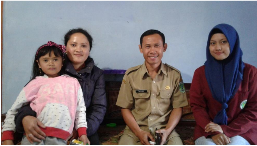
Bersama Perangkat Desa Podokoyo