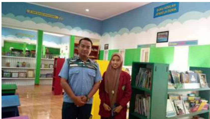
Dok. Perpustakaan Rumah Pintar Juanda Cendikia Sidoarjo. Tgl 03 Mei 2018