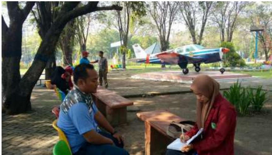
Wawancara: Humas Rumah Pintar Juanda Cendikia Sidoarjo. Tgl 03 Mei 2018