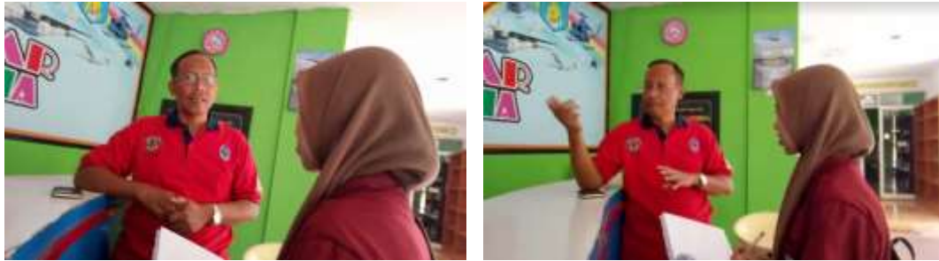
Wawancara: Kepala Rumah Pintar Juanda Cendikia Sidoarjo. Tgl 30 April 2018