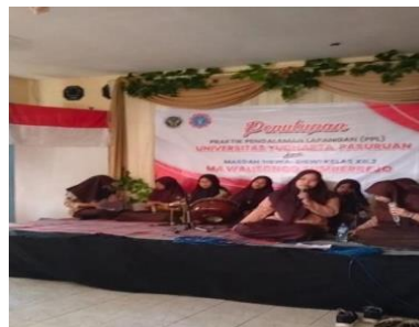
Gambar 5. Penampilan menyanyi bahasa Arab