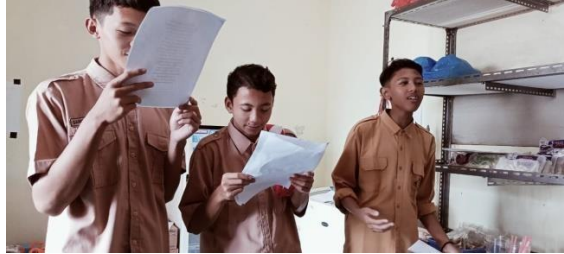
Gambar 2. Pendampingan puisi bahasa Arab

Secara umum program berjalan dengan baik, karena antusiasme guru dan siswa siswi MA Walisongo yang mendukung lancarnya kegiatan pengabdian ini. Kegiatan pengabdian ini dilaksanakan selama 2 kali dengan alokasi waktu 60 menit setiap pertemuannya. Hal ini juga di karenakan kami mengambil jam istirahat siswa.