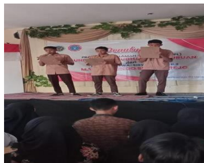
Gambar 4. Penampilan puisi bahasa Arab