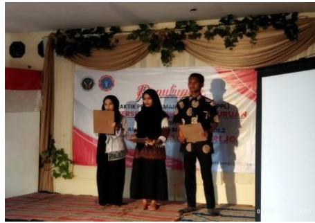
Gambar 3. Penampilan pidato bahasa Arab