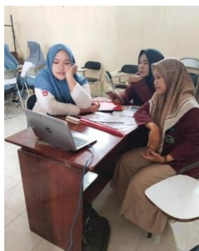
Gambar 1. Pendampingan menyanyi lagu bahasa Arab

Pembelajaran bahasa Arab menyenangkan dalam program ini adalah penggunaan berbagai media dan metode pembelajaran yang dapat menarik minat siswa dalam belajar bahasa Arab. Media yang digunakan agar siswa merasa belajar dengan menyenangkan adalah berupa gambar dan video berisi lagu, puisi dan pidato bahasa Arab yang mudah dipelajari dan dipahami oleh siswa. Metode pembelajaran yang digunakan adalah dengan bernyanyi, berpidato dan membaca puisi.