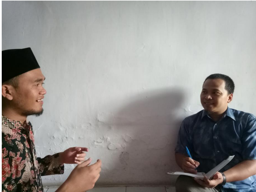
Foto wawancara dengan guru PAI SMK Salafiah Kejayan