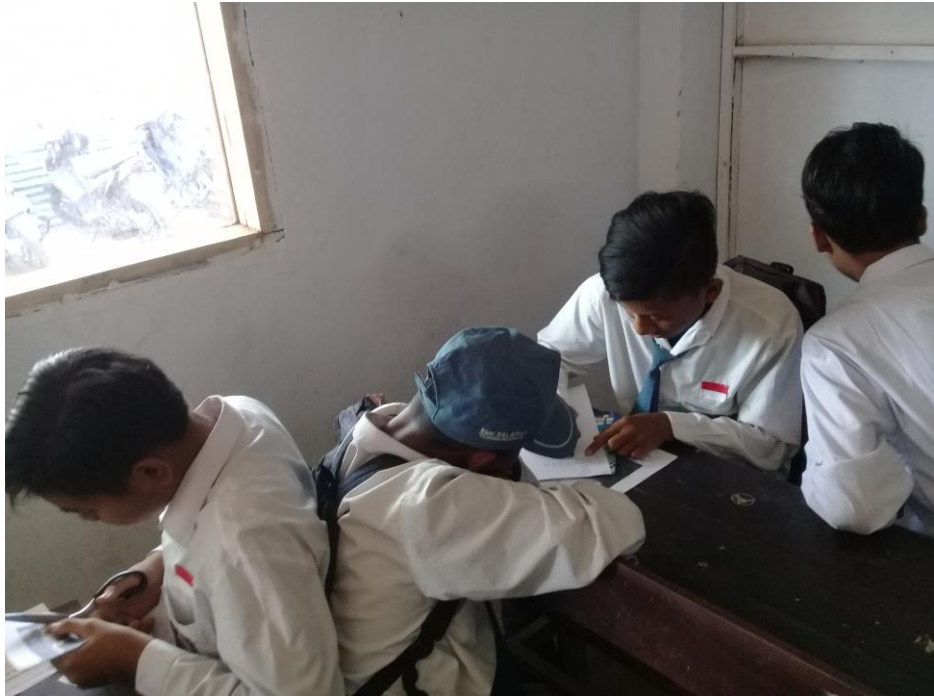
Foto Siswa Sedang Membuat Pertanyaan Dalam Metode From To