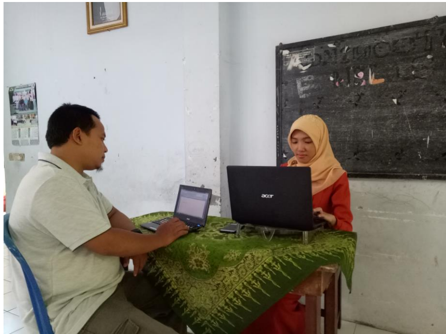
Foto wawancara dengan waka kurikulum SMK Salafiah Kejayan