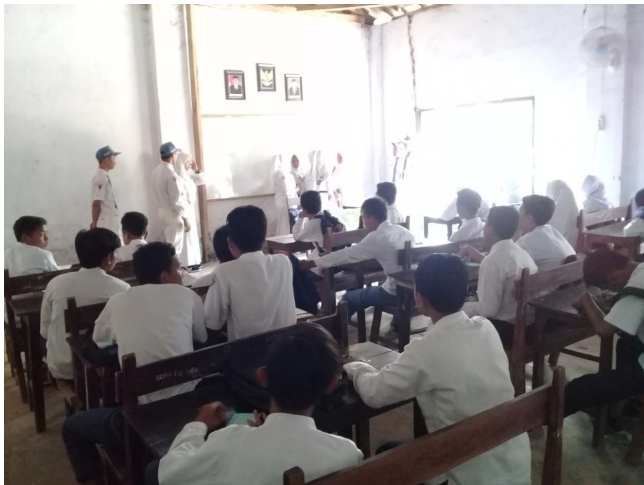
Keaktifan Siswa Dalam Metode From To