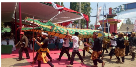
Gambar 1. Upacara Distrikan di Danau Ranu Desa Ranuklindungan

Penelitian mengenai makna simbolik larung tumpeng dalam “upacara distrikan” ini sangat penting dilakukan, karena mengingat komunikasi pemaknaan simbolik pada larung tumpeng dalam “upacara distrikan” ini jarang diangkat kedalam sebuah penelitian ilmiah khususnya dalam konteks Ilmu Komunikasi. Selain itu, penelitian ini dilakukan agar dapat memperkaya pemahaman masyarakat luas mengenaimakna simbolik serta sebagai media pengenalan komunikasi simbolik bagi khalayak luas yang mana pada penelitian makna simbolik larung tumpeng dalam “upacara distrikan” dikaitkan dengan teori-teori komunikasi yang ada. Penelitian ini akan menekankan pada bagaimana pemahaman makna simbolik larung tumpeng dalam “upacara distrikan” di Danau Ranu pada masyarakat Desa Ranuklindungan Kecamatan Grati Kabupaten Pasuruan yang setiap tahapannya menggunakan perspektif pendekatan teori semiotika Charles Sanders Peirce.