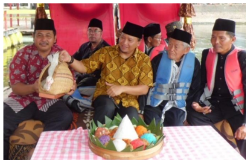
Gambar 3. Foto Ancak Nasi Warna simbol upacara Distrikan Desa Ranuklindungan