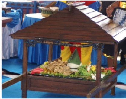
Gambar 4.3 Foto Tumpeng simbol upacara Distrikan Desa Ranuklindungan