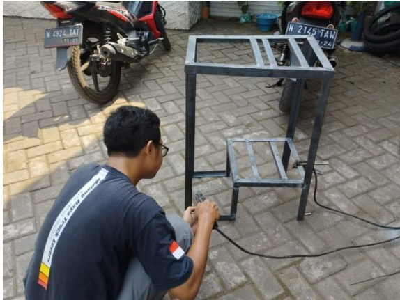
Proses Pengelasan Mati Frame