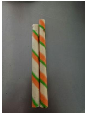
(Panjang tidak sesuai)