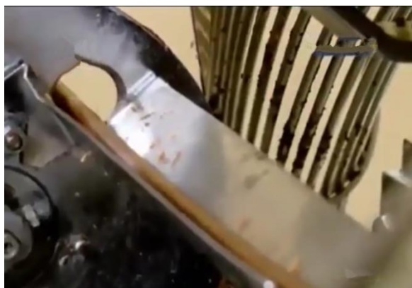
Proses pemotongan wafer stick