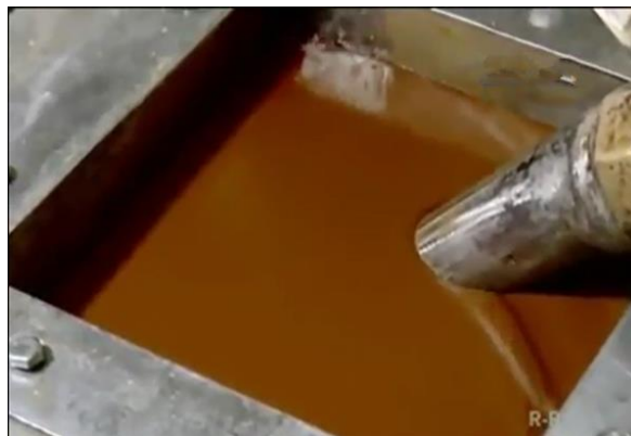
Mesin saring adonan wafer stick