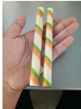
(diameter tidak sesuai)