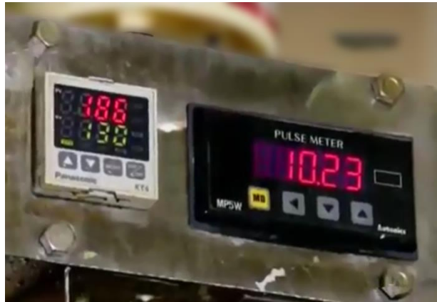
Mesin pendeteksi suhu wafer stick