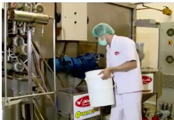
Tempat adonan wafer stick