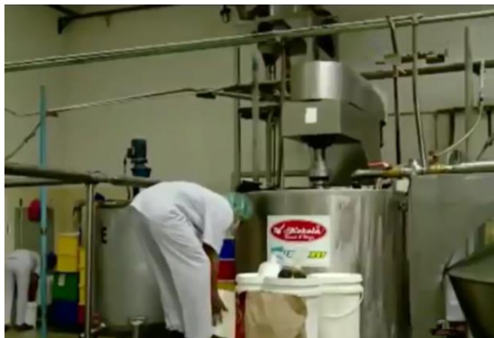
Mesin pengadukan cream wafer stick