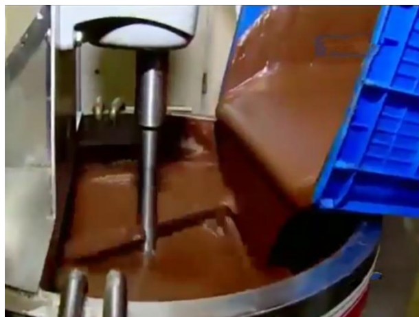
Tempat cream wafer stick