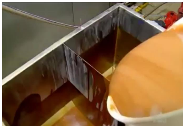
Tempat adonan wafer stick