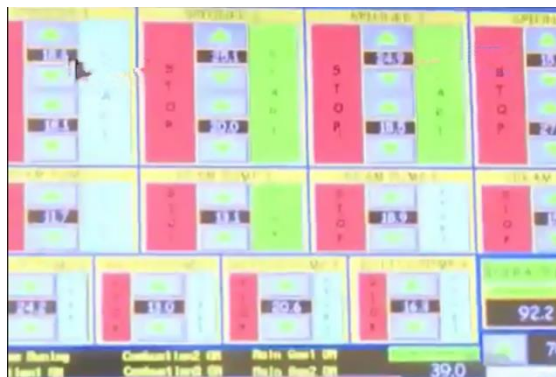
Mesin pengatur cream wafer stick