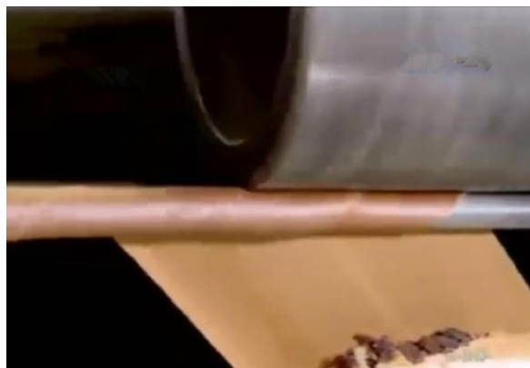
proses penggulungan wafer stick