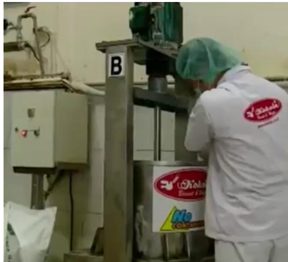
Mesin pengadukan adonan wafer stick