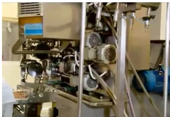
Mesin Wafer stick egg roll making machine