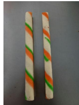
(warna tidak sesuai)