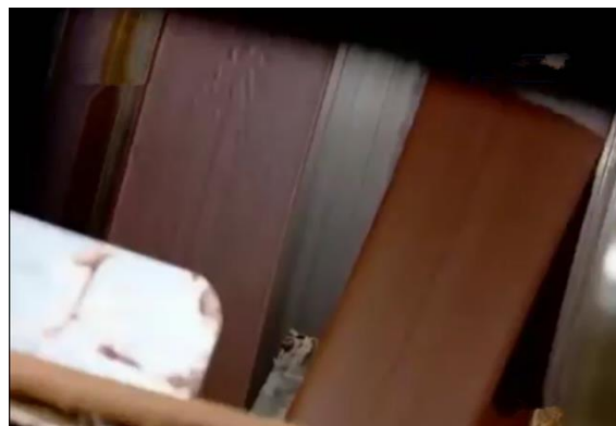
proses pembentukan wafer stick