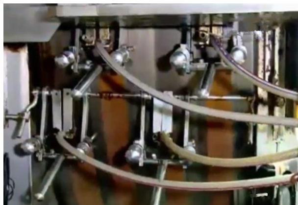
Mesin Loyang panggang wafer stick