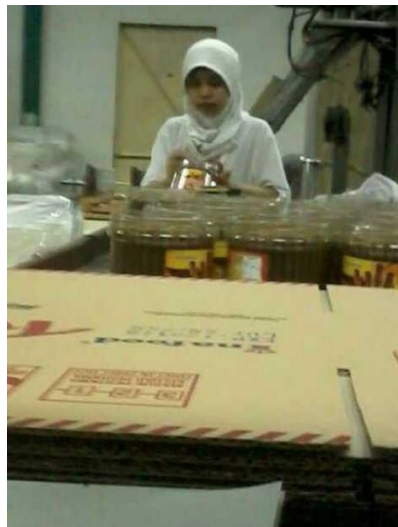
Proses packing Wafer stick