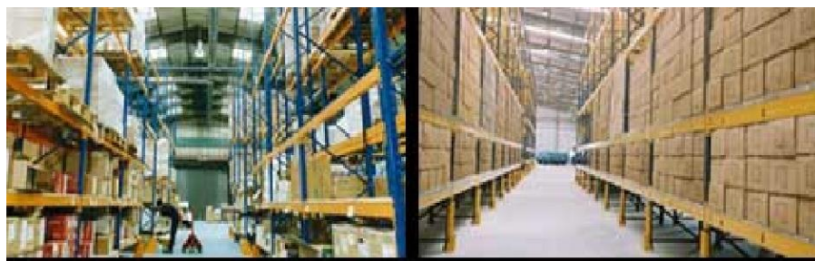
Gudang penyimpanan wafer stick