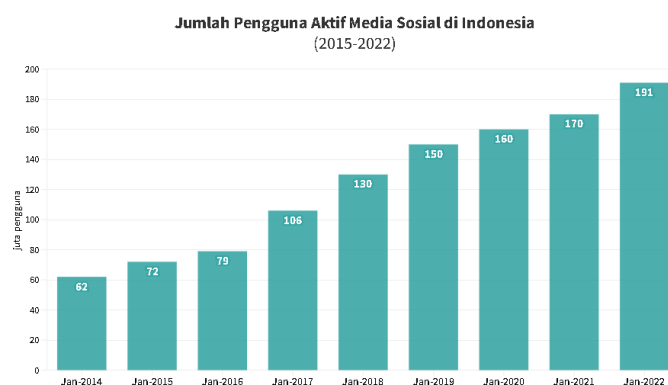
Gambar 1.1 Platform Media Sosial di Indonesia

Menurut laporan dari We Are Social pada bulan Januari 2022, Indonesia memiliki sekitar 191 juta individu yang secara aktif menggunakan platform media sosial. Jumlah ini mengalami peningkatan sekitar 12,35% dibandingkan dengan tahun sebelumnya yang mencapai 170 juta pengguna. Akibat dari tren ini, jumlah orang yang menggunakan media sosial di Indonesia terus mengalami peningkatan dari satu tahun ke tahun berikutnya. Namun, pertumbuhan ini tidak stabil dari tahun 2014 hingga 2022. Peningkatan jumlah pengguna media sosial yang paling signifikan terjadi pada tahun 2017 dengan kenaikan mencapai 34,2%. Namun, peningkatan tersebut melambat menjadi 6,3% pada tahun sebelumnya. Hanya pada tahun ini, jumlah pengguna media sosial kembali mengalami peningkatan.