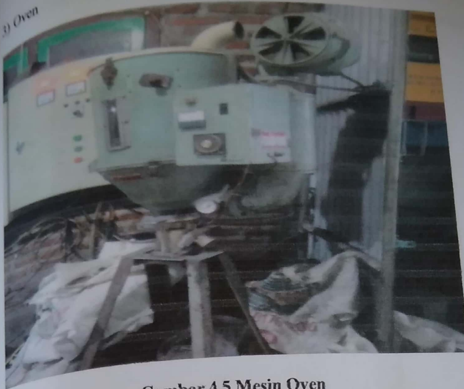
Gambar 4.5 Mesin Oven