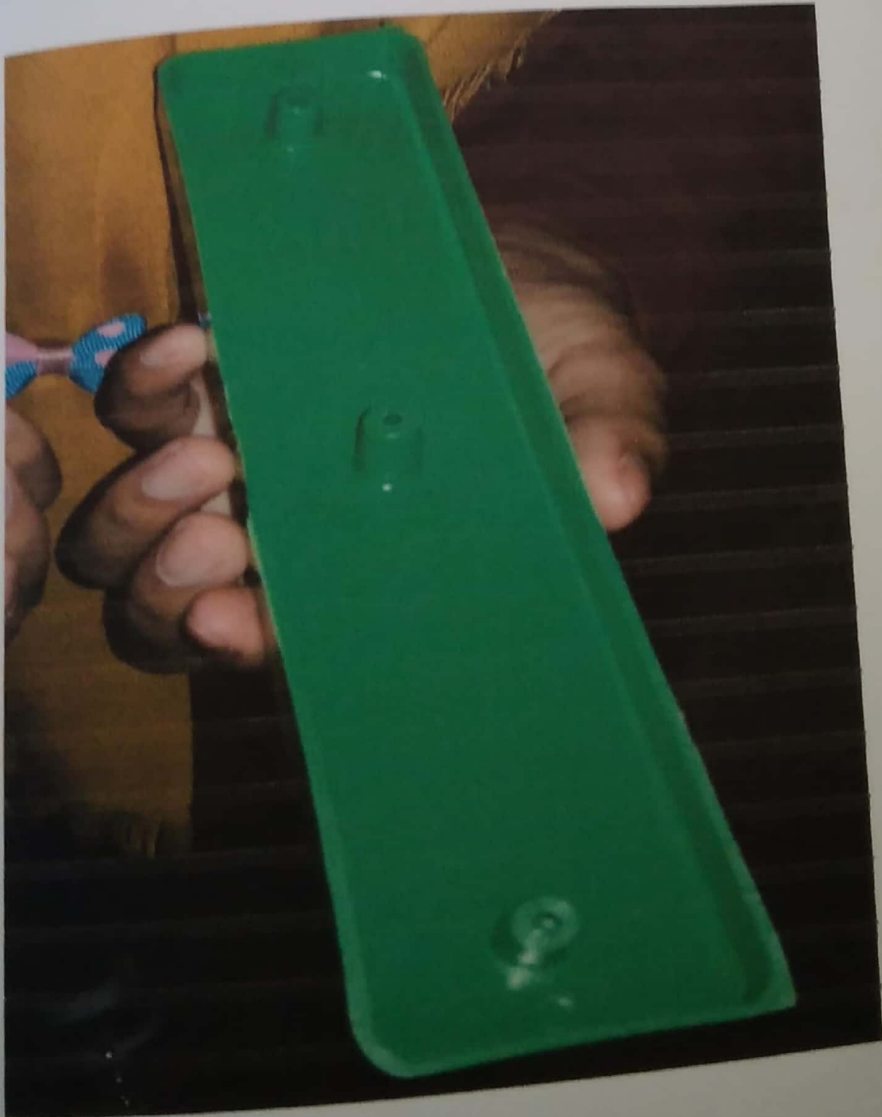
Gambar 4.9 Lakop Tidak Gopel