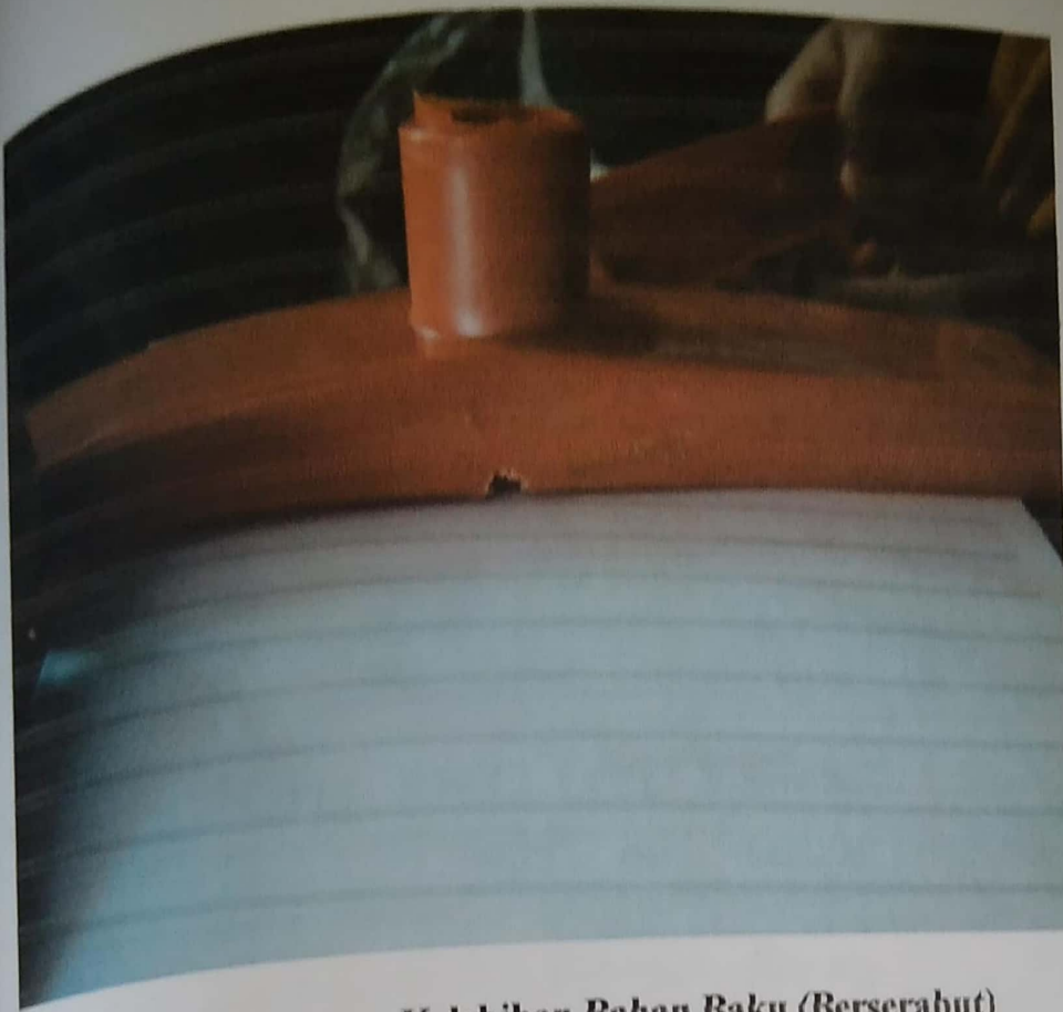
Gambar 4.10 Lakop Kelebihan Bahan Baku (Berserabut)