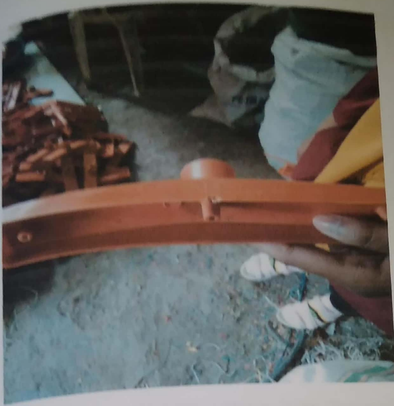
Gambar 4.8 Lakop Pecah atau Gopel