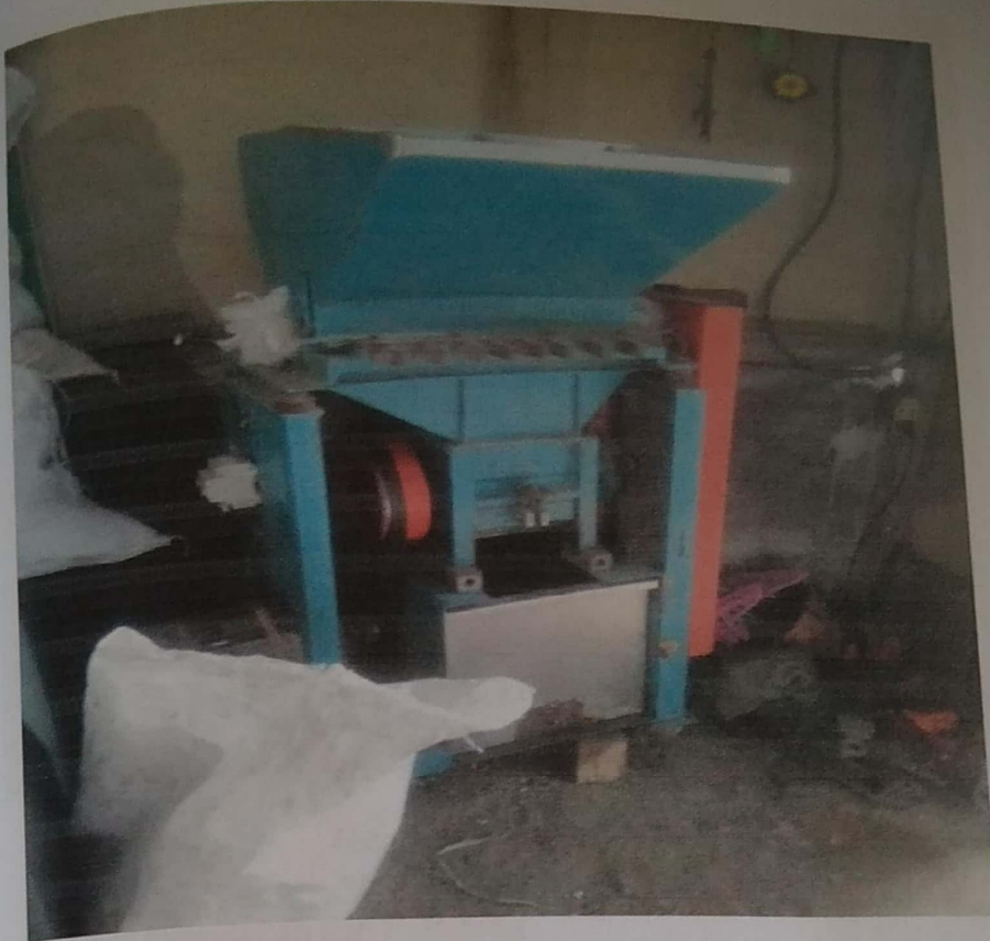
Gambar 4.3 Mesin Penghalusan