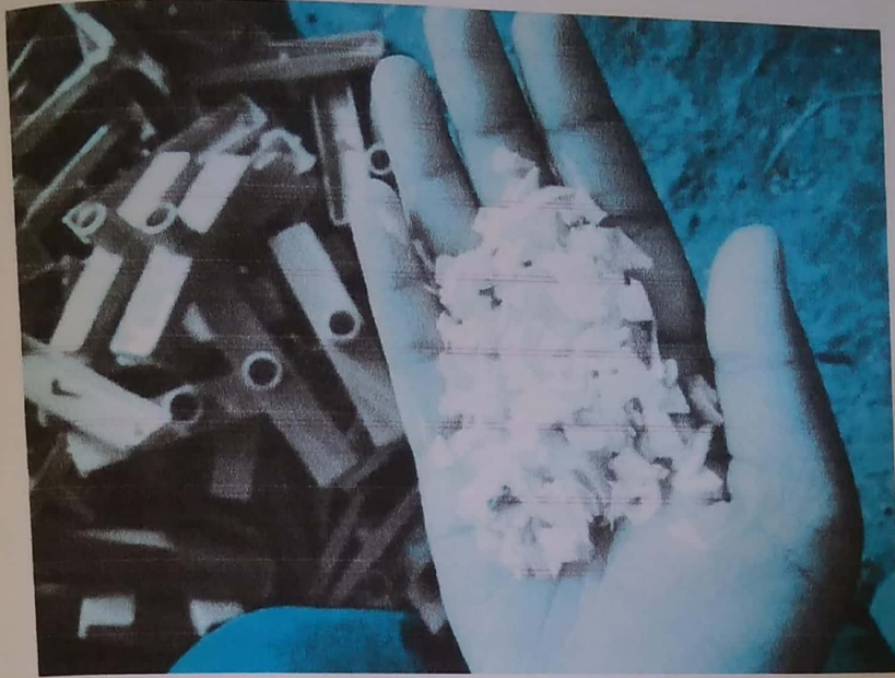
Gambar 4.1 Bahan Baku HD (Tutup)