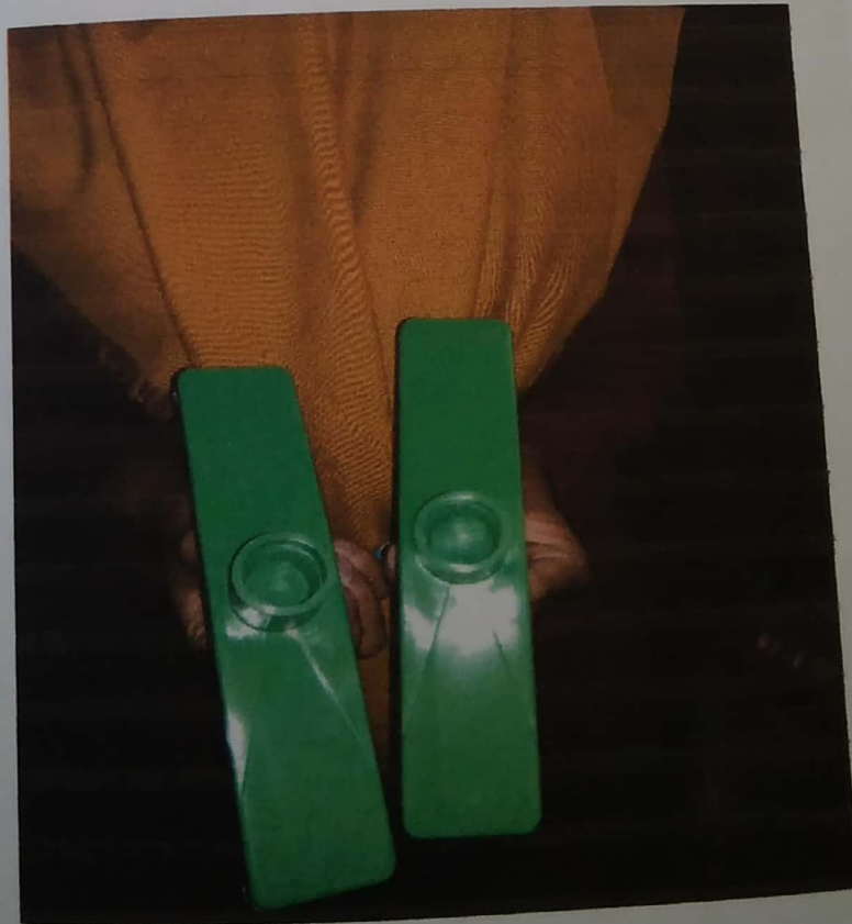
Gambar 4.7 Lakop Warna Cerah Sesuai Standar