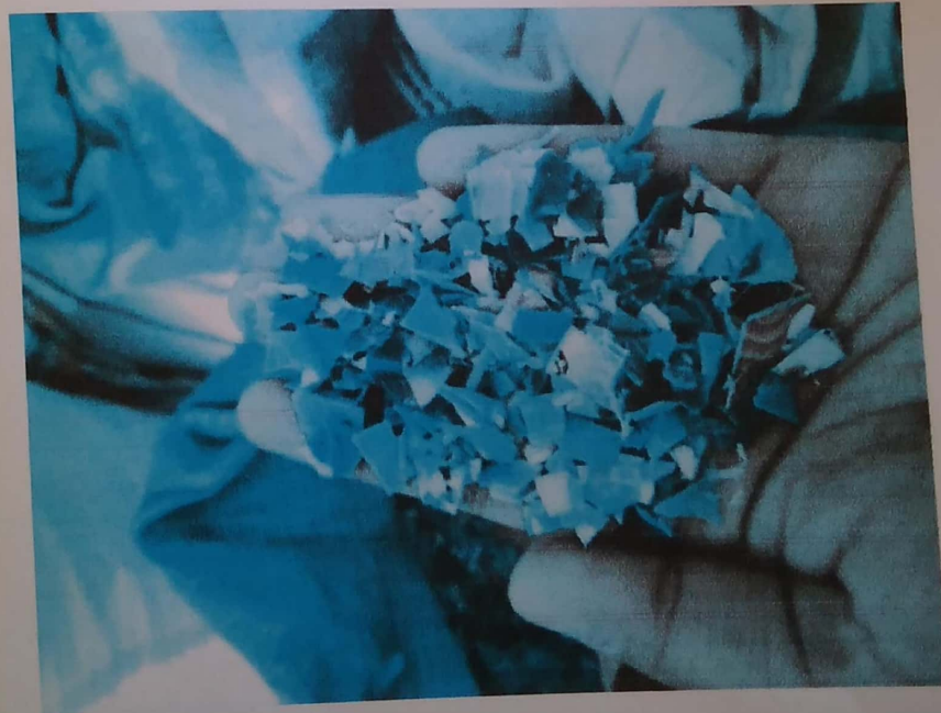
Gambar 4.2 Bahan Baku HD (Tutup)