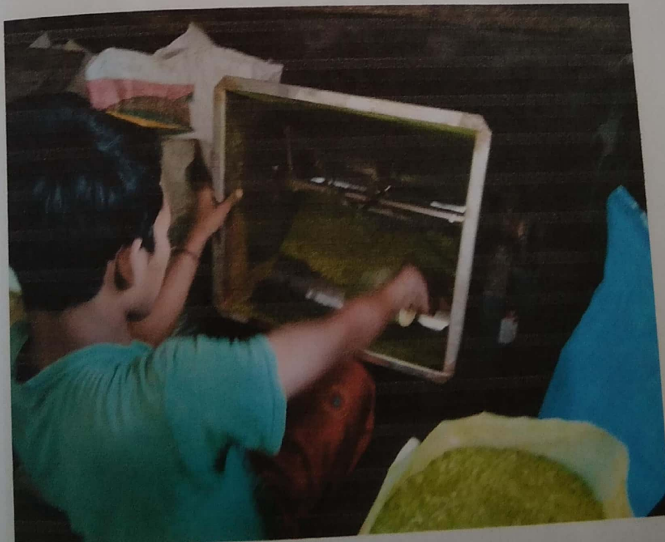
Gambar 4.4 Mesin Penghalusan