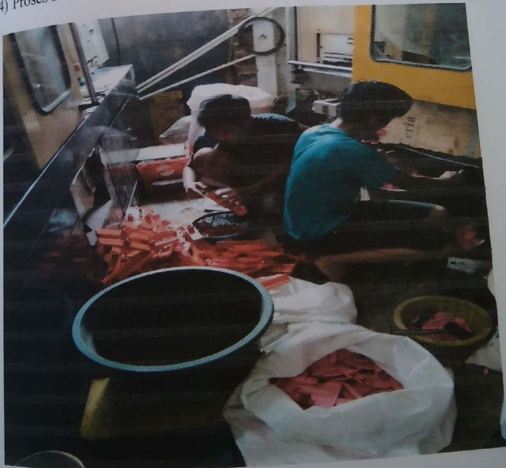
Gambar 4.5 Proses Pencetakan dan Finishing