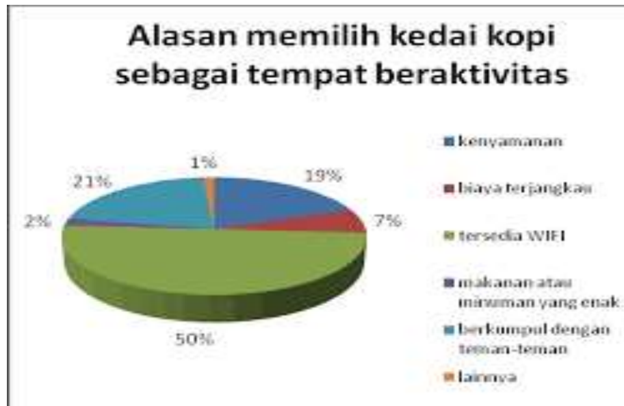
Gambar 1.1 Alasan Konsumen Ke Kedai Kopi

dan menciptakan ikatan emosional antara brand Terhadap para pelanggannya. Selain itu, akan meningkatkan loyalitas mereka terhadap brand tersebut.