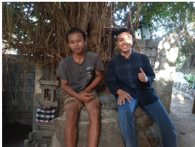
Bersama pecandu wahyu