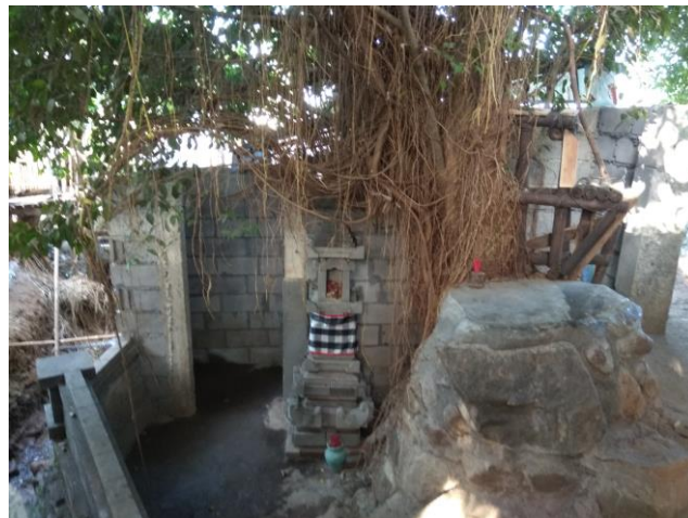
Jalan masuk sumber