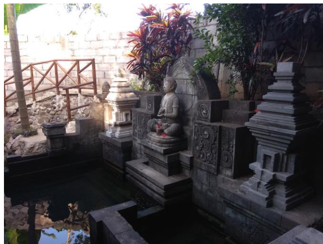
Sumber tempat mandi