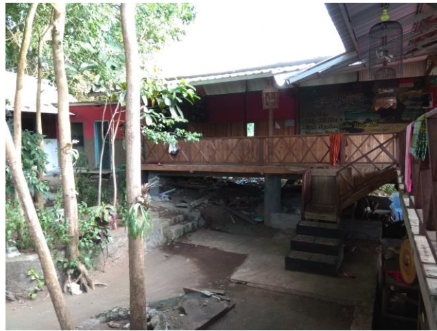
Tempat istighosah dan sholawatan