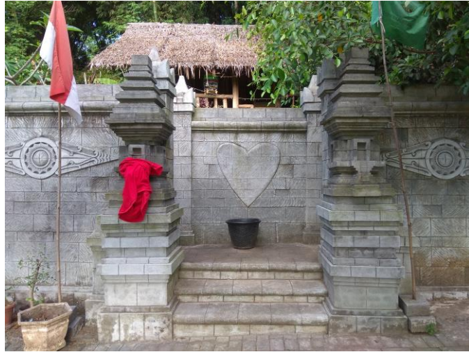
Pagar depan padepokan