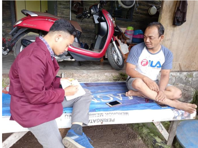
Bersama mantan pecandu gigi romantir