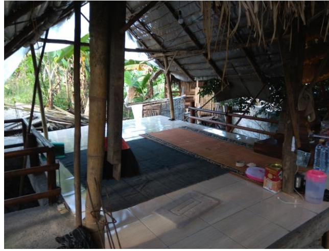
Tempat menerima tamu