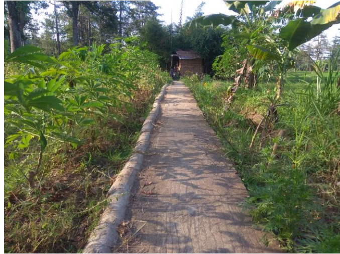
Gambar jalan masuk