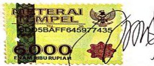
NININ CINDARIN Penulis