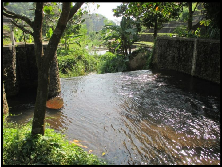
Foto Jaringan Irigasi Manggian