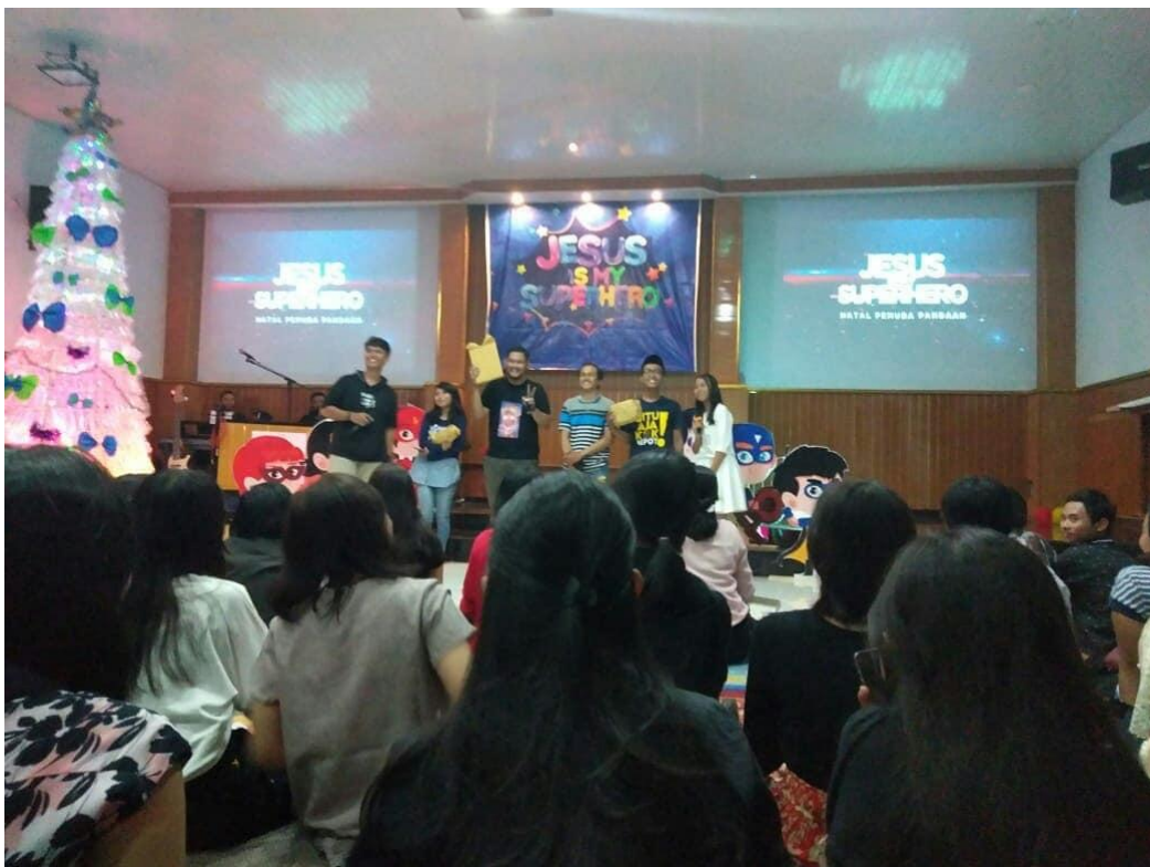
Dokumentasi kegiatan merayakan hari raya Natal bersama Ormas lain, Maupun Agama lain di GKJW Pandaan pada tahun 2018