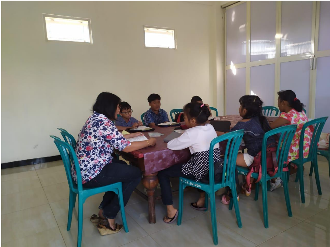
Dokumentasi Kegiatan Minggu remaja yang dilakukan oleh GKJW Pandaan pada tahun 2019