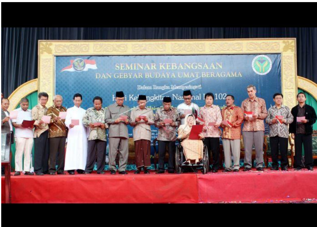
Acara seminar kebangsaan yang diadakan di pondok pesantren Ngalah pada tahun 2010