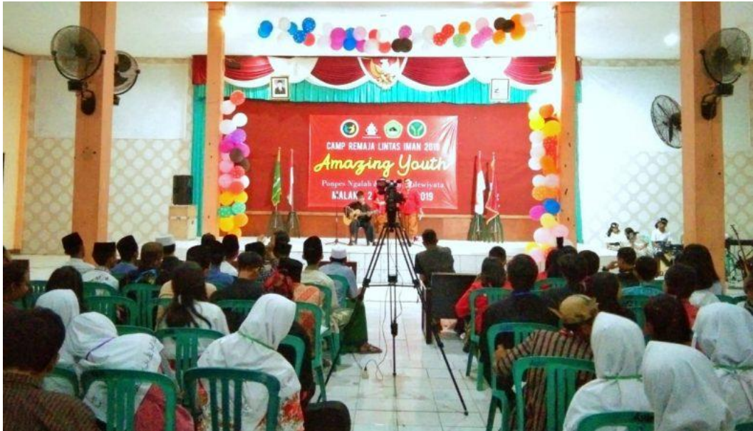
Dokumentasi kegiatan Camp Remaja Lintas Iman yang diadakan oleh GKJW Pandaan tahun 2019