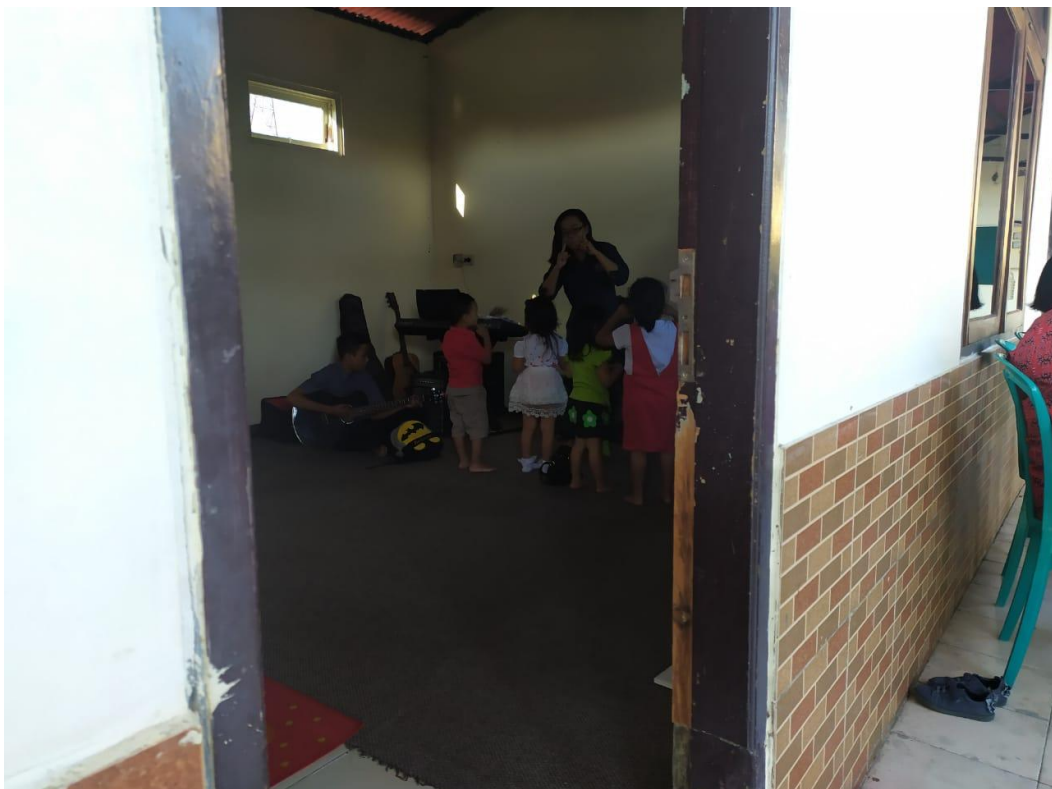
Dokumentasi kegiatan Minggu balita yang dilakukan oleh GKJW Pandaan pada tahun 2019