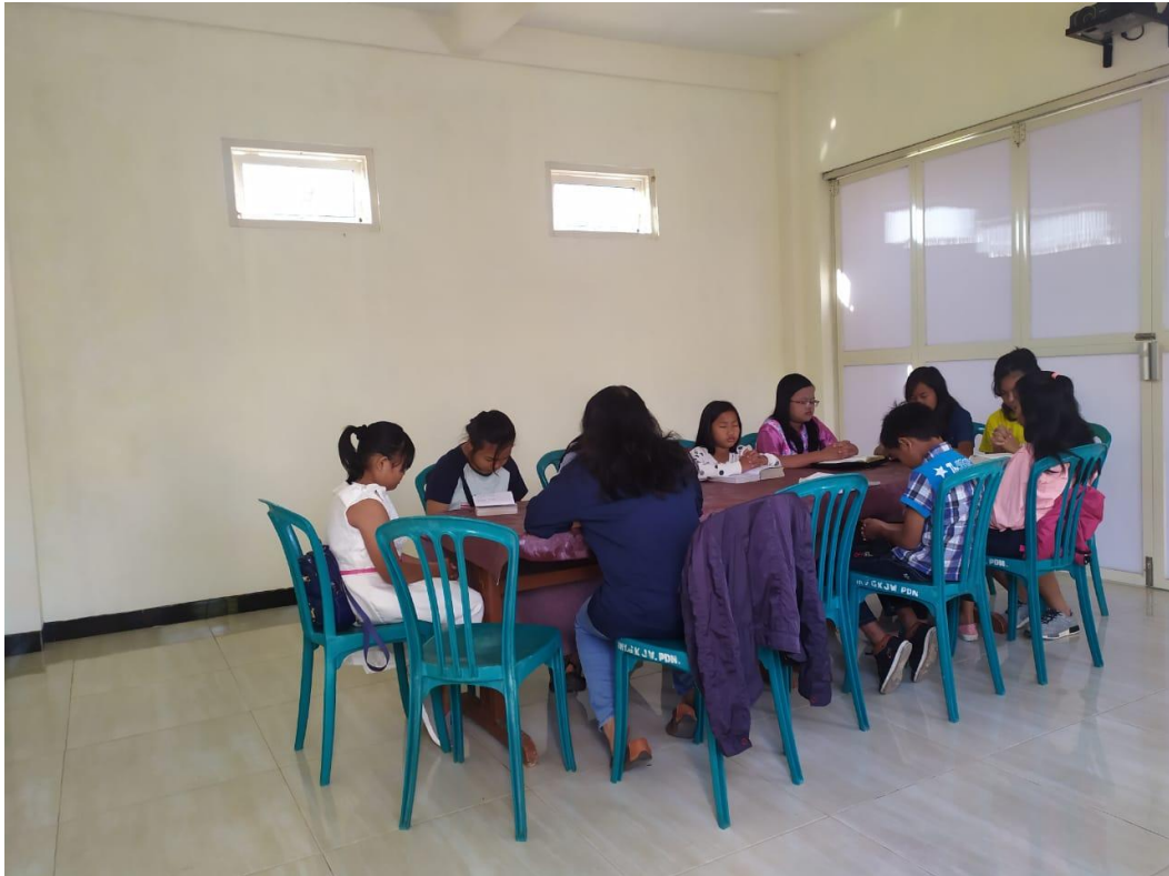
Dokumentasi Kegiatan Minggu remaja yang dilakukan oleh GKJW Pandaan pada tahun 2019