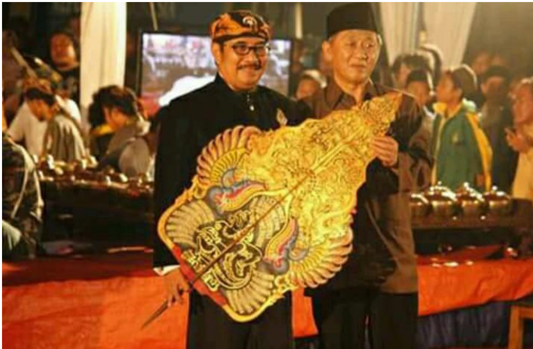
Dokumentasi kegiatan budaya wayang kulit di halaman Universitas Yudharta Pasuruan