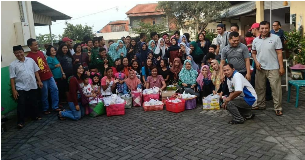
Peneliti mengikuti kegiatan dalam bagi takjil dan buka bersama yang diadakan oleh GKJW Pandaan pada tahun 2019