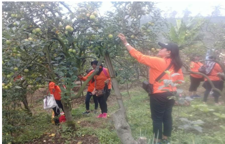
Foto Ibu-ibu sanggar senam yang datang wisata Petik (bentuk kerjasama pihak pengelola wisata desa Kayukebek dengan Sanggar Surya atau sanggar senam)