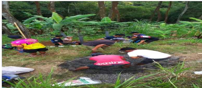
Kerjabakti pembuatan Jalan menuju Coban Waru