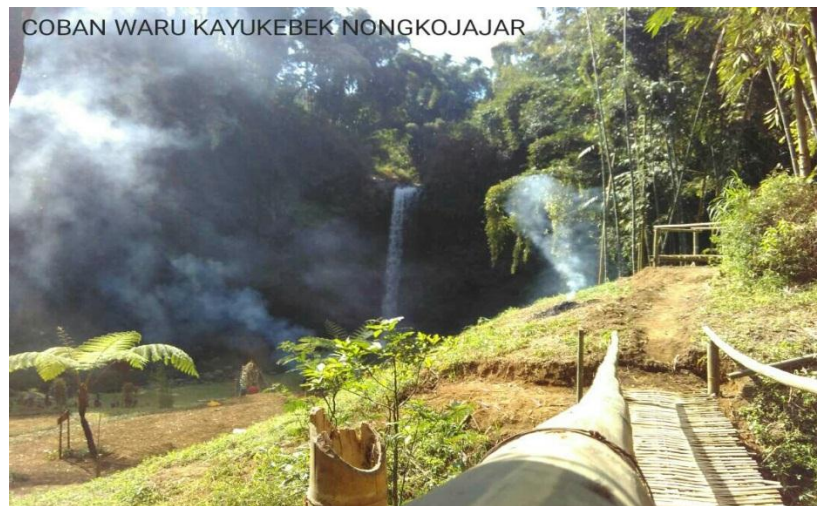
Foto Wisata Coban Waru Dusun Taman Desa kayukebek