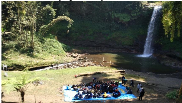
Makan bersama pada saat Camping Ground