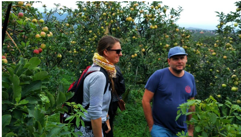
Foto Tamu Plataran (wisatawan Mancanegara) yang diajak berkunjung ke wisata Petik Apel Di Desa Kayukebek