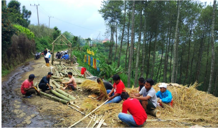
Foto kerja bakti pembuatan spot foto dan fasilitas di Wisata Coban Waru