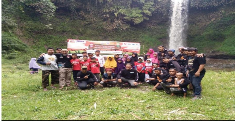
Foto Kunjungan anak yatim piatu ke wisata Coban Waru (hasil atau bentuk kerjasama dengan Askar Ramadhan)