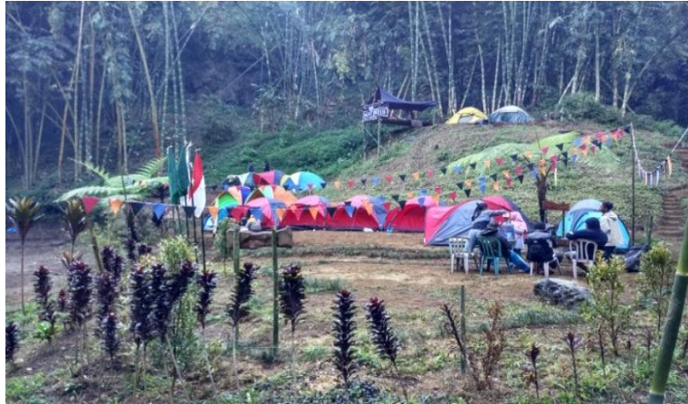
Suasana camping Ground pada Bulan Juli 2018