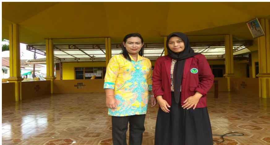
Foto dengan salah satu perangkat desa Kayukebek pada saat penelitian ke Kantor Desa Kayukebek.