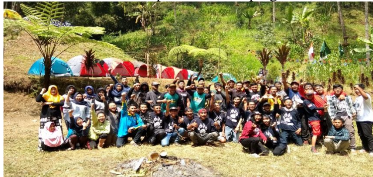
Peserta Camping Ground (Pemuda Kayukebek, Panthera Camp dan IPNU Kayukebek)