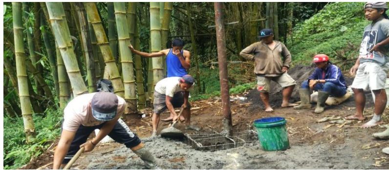
Foto kerjabakti pengecoran tempat wisata di Coban Waru