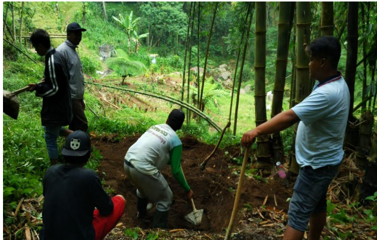
Kerja Bakti membersihkan lahan Yang akan digunakan sebagai tempat wisata Di Coban Waru