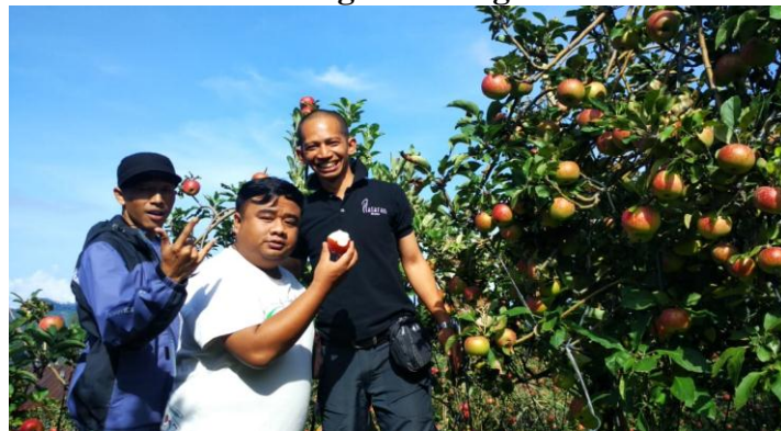
Foto tamu plataran Bromo yang diajak mengunjungi wisata petik apel Dusun Taman Desa Kayukebek