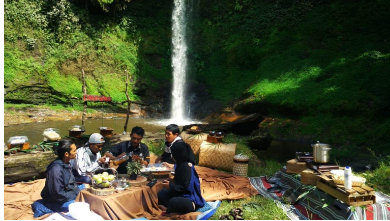
Salah satu inovasi wisata Coban Waru (Kopdar Di Coban Waru)

Salah satu bentuk Inovasi Wisata di Coban Waru (Camping Ground)