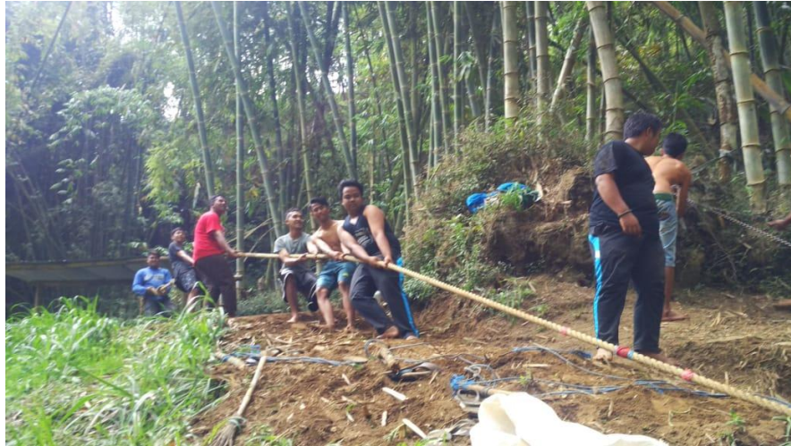
Pemaanfaaan tenaga organisasi pemuda Panthera Camp dan IPNU Dalam mengelola wisata Coban Waru