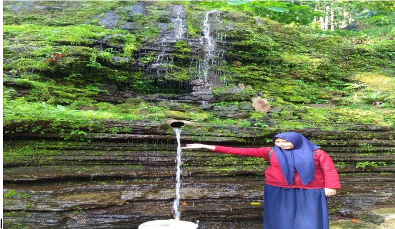
Foto Wisata Sendang Sri Alam Sari (wisata Alam dan Religi) Dusun Ledok Desa Kayukebek