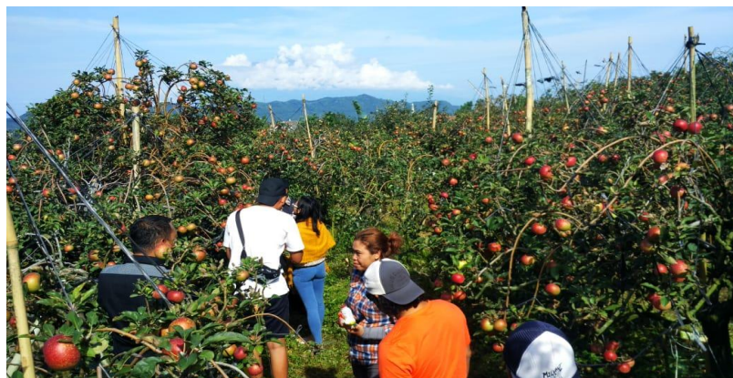
Foto Wisata Petik Apel Dusun Taman Desa kayukebek