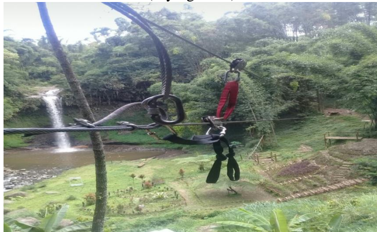
Inovasi Wisata Di Coban Waru