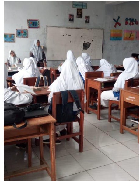
Dokumentasi saat pelaksanaan evaluasi menggunakan paper