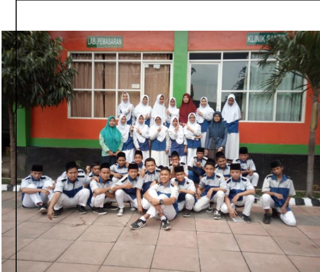
foto bersama kelas XI SMK AL-INAYAH